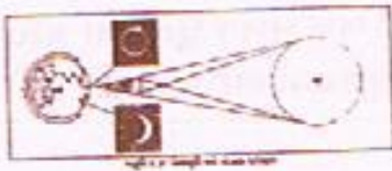
આકૃતિ ૨) અમાસનું સૂર્ય ગ્રહણ