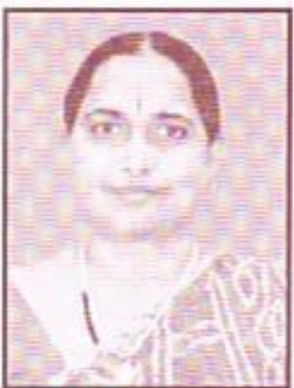
Tank Lata J.